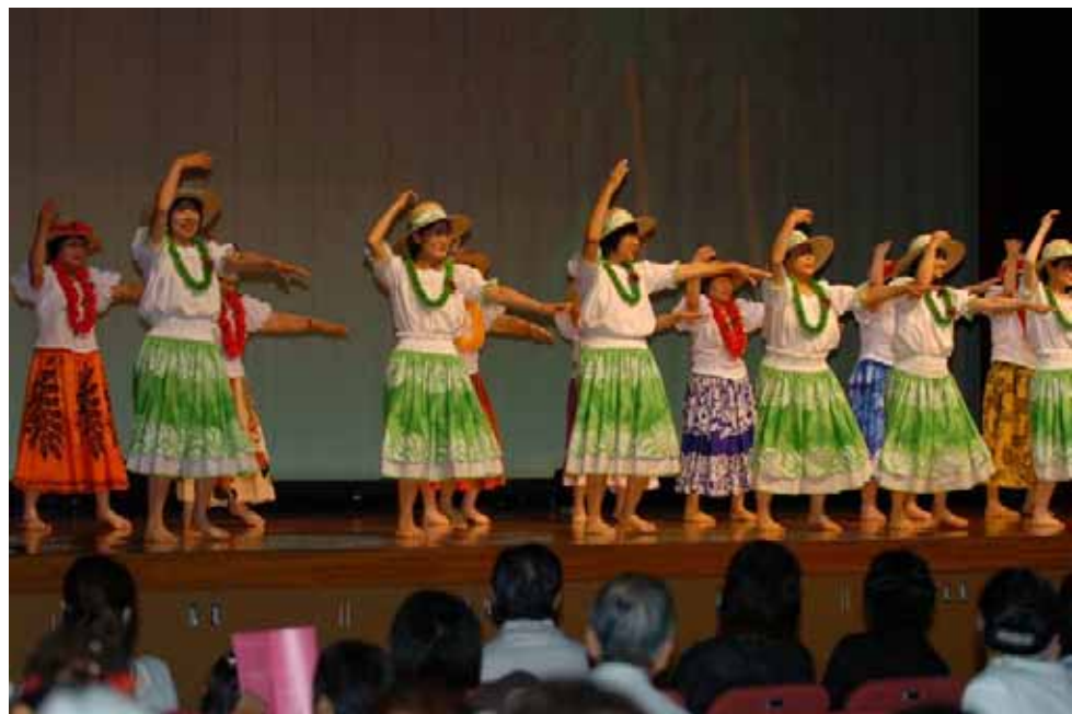
情感たっぷり、道新文化センターの受講生にフラの世界を熱演する