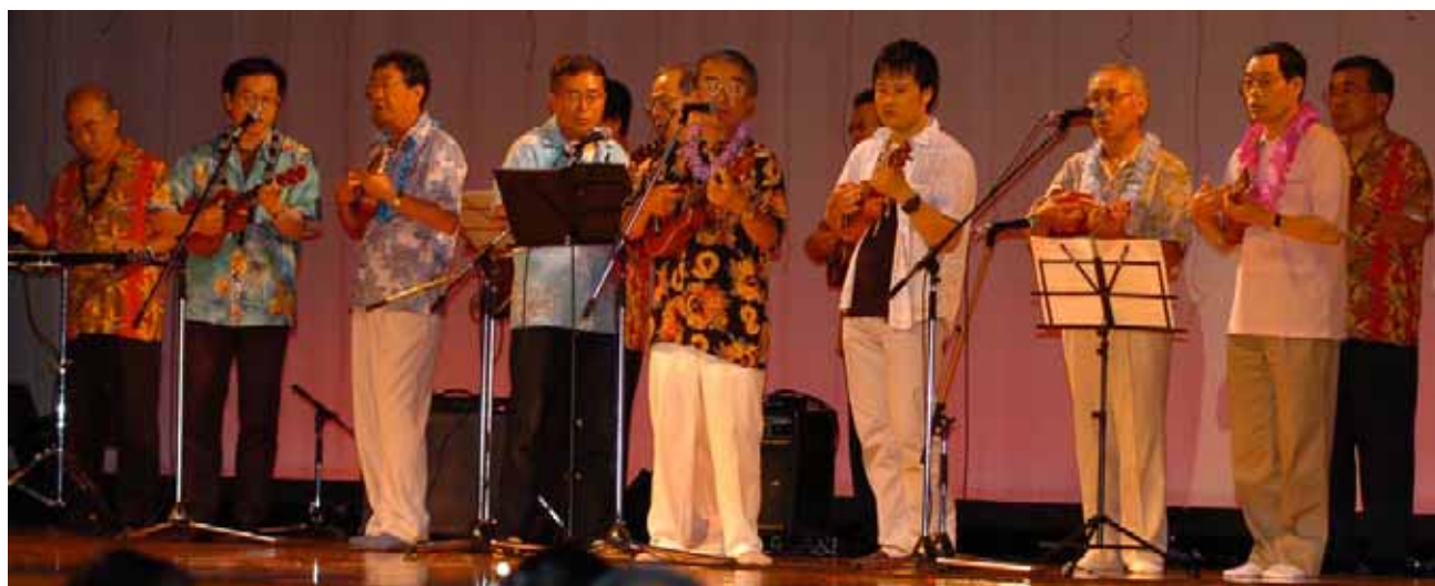
北海道ハワイアンクラブの「ブルー・ハワイアンズ」がバンド演奏で友情出演