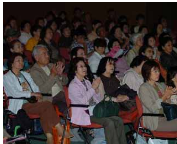
「愛・友情・連帯」を示す「アロハ」の舞台に温かい拍手を送る夕張市民