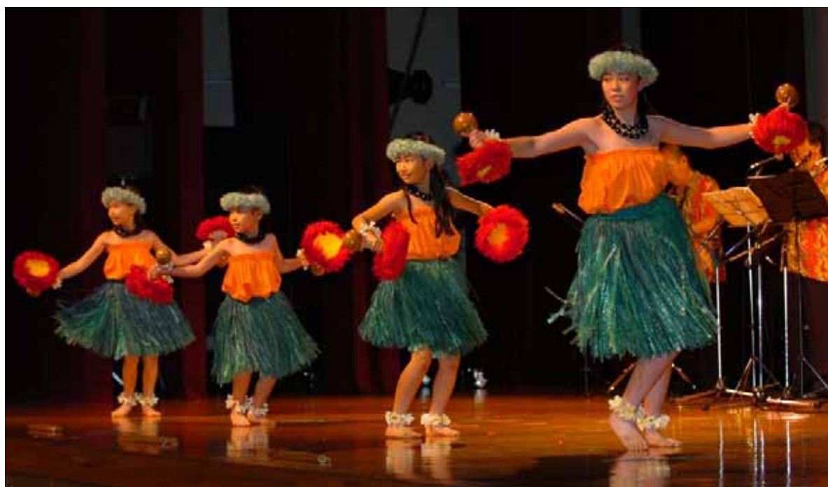
小学生ばかりで構成する「ケイキ・フラ」のかわいい踊り。ケイキとは、ハワイ語で「子ども」を意味する