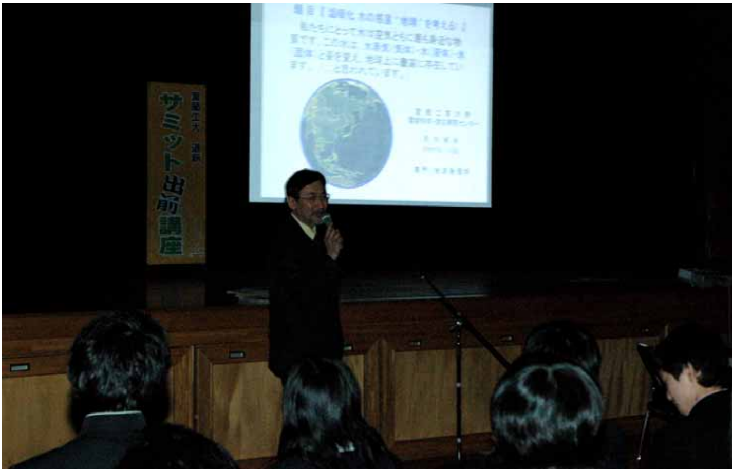
サミットや身近な環境問題をスライドを使って解説した出前講座。中学生たちが熱心に耳を傾けた