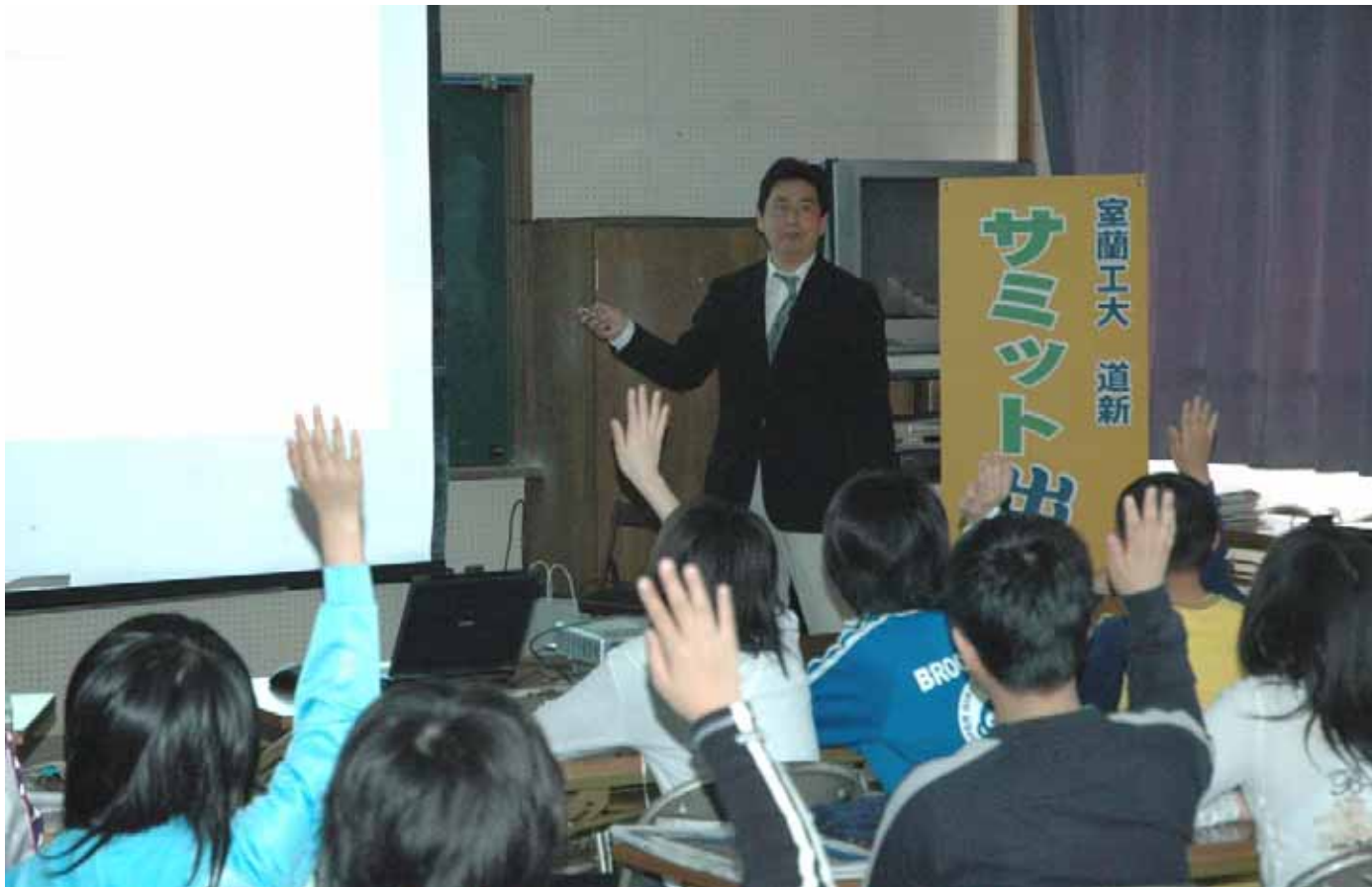
サミットや身近な環境問題を解説した出前講座。小学生たちが熱心に耳を傾けた

出前講座は三月から始まった。サミット開幕前の六月中旬まで西胆振の小中学校で行う。