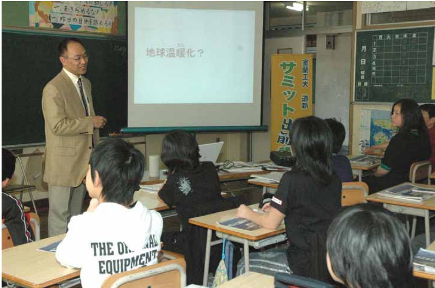
サミットや身近な環境問題を解説した出前講座。小学生たちが熱心に耳を傾けた

出前講座は三月から始まっており、サミット開幕前の六月中旬まで西胆振の小中学校で行う。