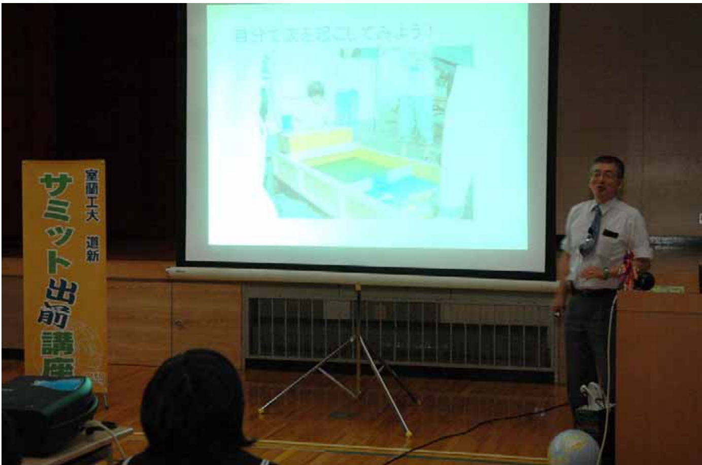
サミットや身近な科学について解説した講座。中学生が真剣に耳を傾けた

【洞爺湖】七月の北海道洞爺湖サミットに向け、子どもたちの関心を高めようと、室蘭工業大と北海道新聞室蘭支社は十三日、町立洞爺中(及川信道校長)でサミット出前講座を開いた。サミットの歴史や意義に加え、議題となる環境問題について室工大教員や道新記者がスクリーンを使って解説した。