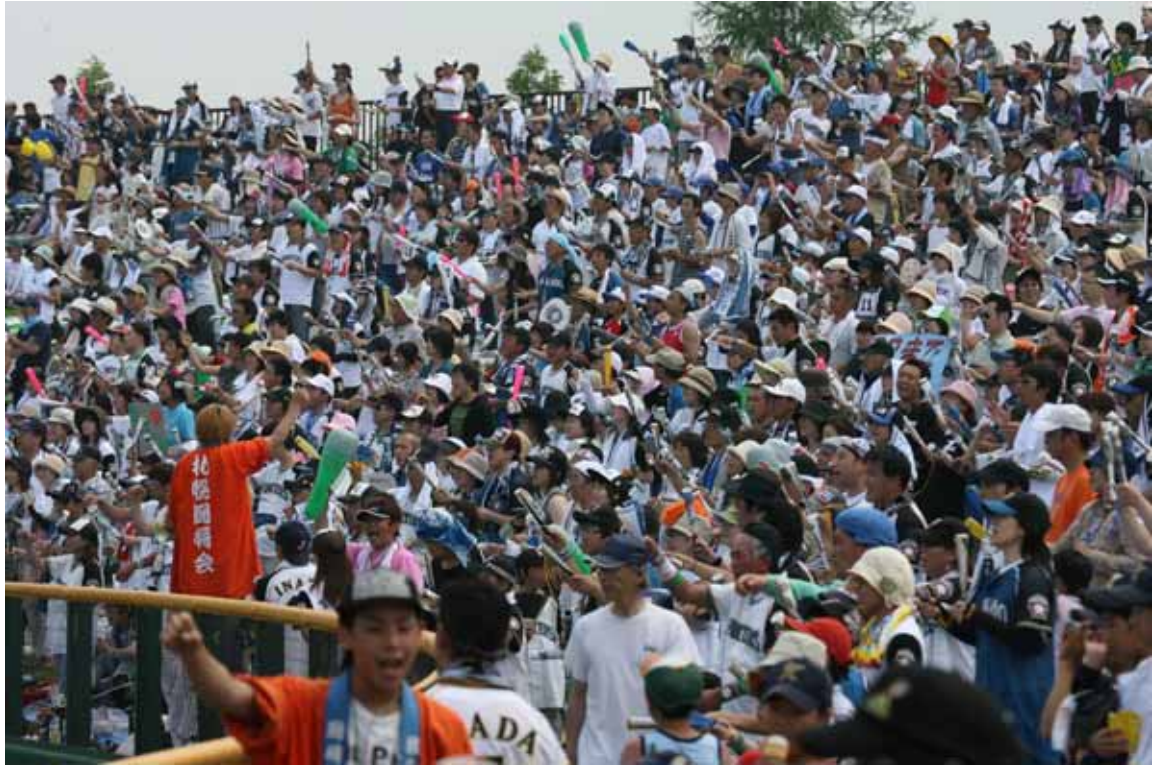
グラウンドの日本ハムナインに熱い声援を送るファン