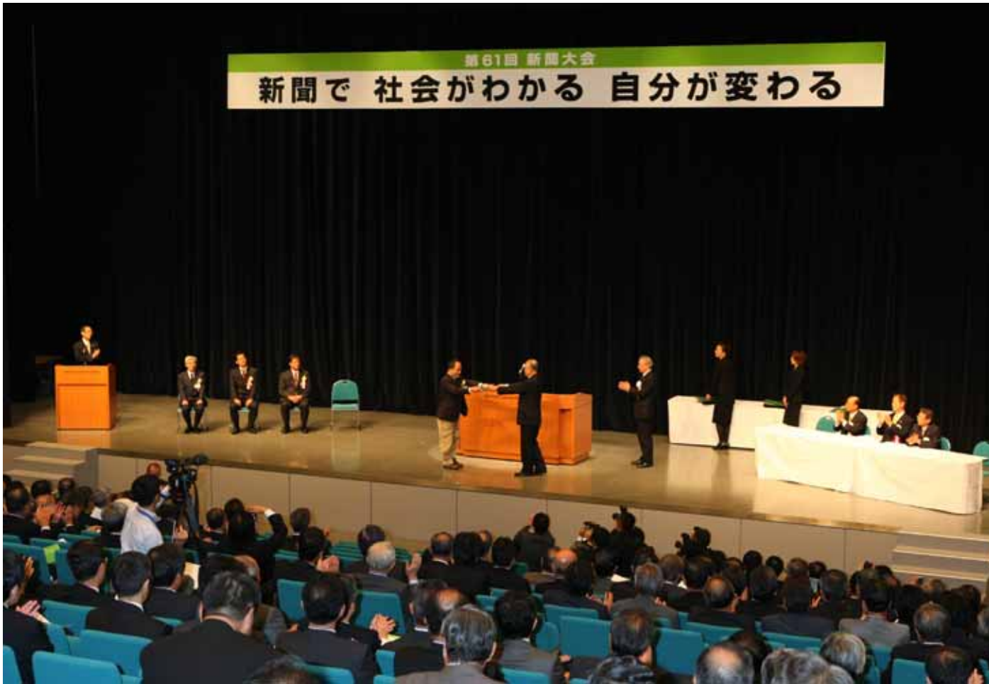
協会賞授賞式などが行われた第61回新聞大会