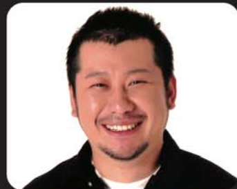
ケンドーコバヤシ