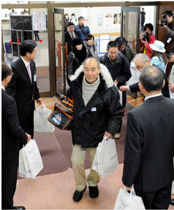
一番機で到着し記念品を受け取る東京からの乗客

機体の側面と尾翼に同社のマスコットを描いたボーイング737-500型(126席)「ベア・ドゥ・ドリーム号」が午前8時40分ごろ、帯広空港に到着。エア・ドゥとちかち帯広空港利用促進協議会(会長・米沢則寿市長)は、東日本大震災の甚大な