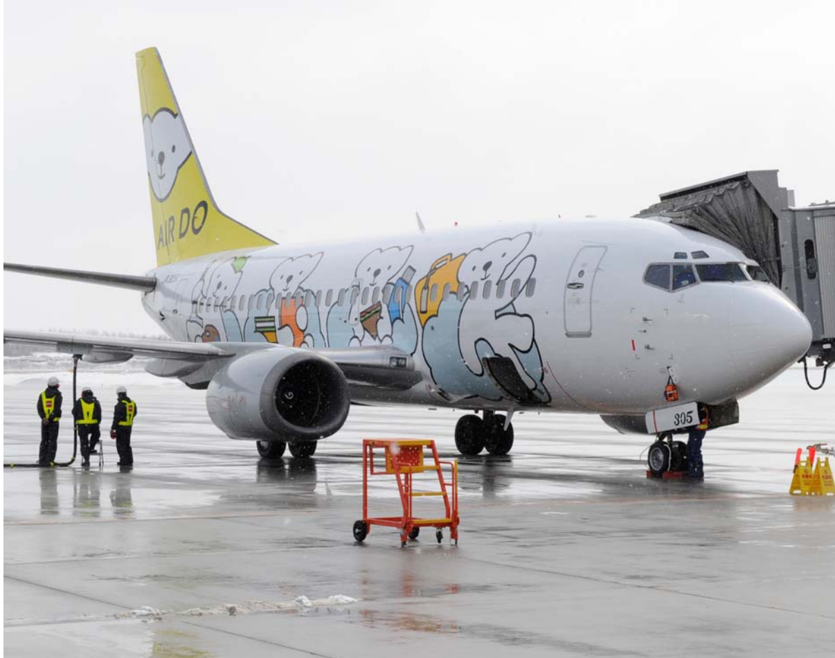
帯広空港に到着した東京からの一番機「ベア・ドゥ・ドリーム号」＝27日午前8時50分

帯広空港 帯広市の中心部から南に約25キロ(バスで約40分)。1981年に現在の場所に移転しジェット化した。とちかち帯広空港は十勝平野の風景に合わせた色調となっている。エアライオンパイロットを養成する航空大学帯広分校が設置されている。