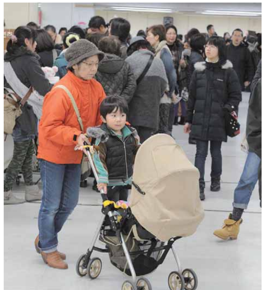
「毎年楽しみにしているイベントです。すごい人出で、この熱気で町も元気になりそう」と、会場を巡っていた