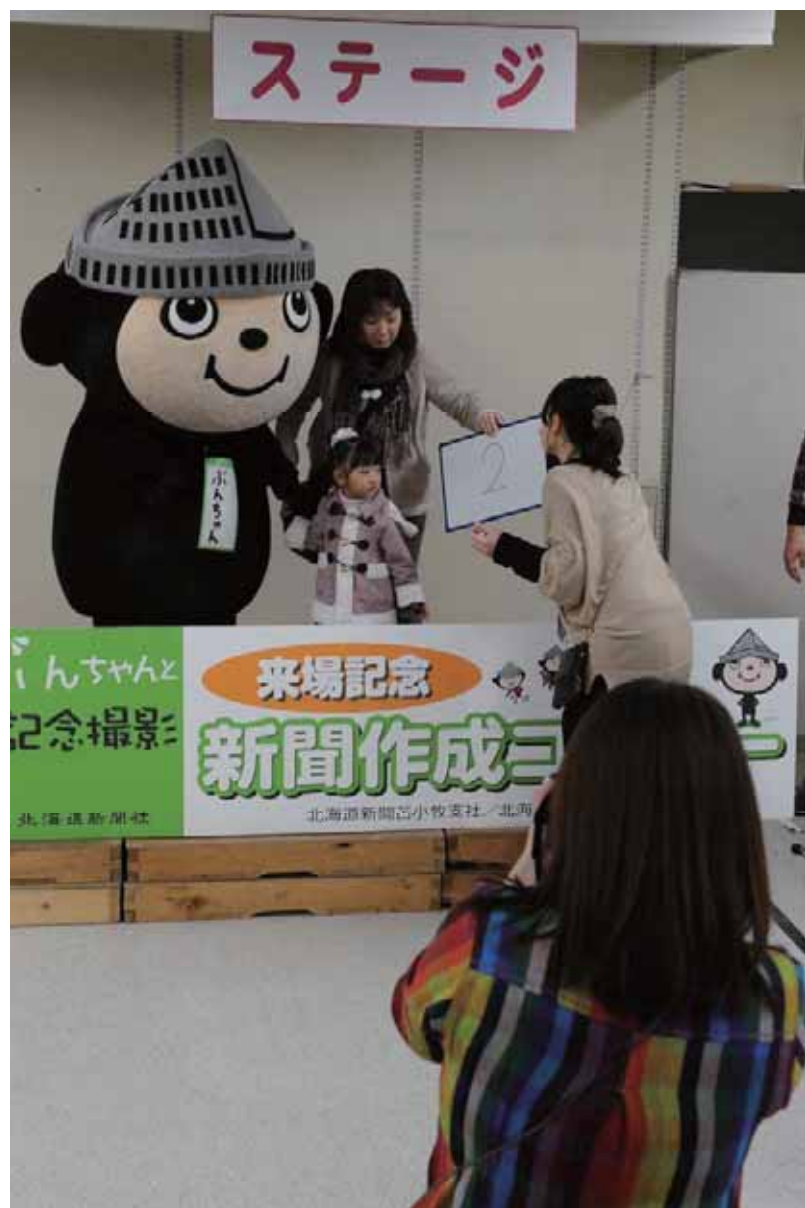
道新ぶんぶんクラブのマスコットキャラクター「ぶんちゃん」と記念撮影

【苫小牧】「苫小牧よくばりマルシェ2012」(実行委員会、道新とまこむ編集室、北海道新聞苫小牧支社主催)が、苫小牧駅前プラザエガオ3階の特設会場で23日、開催された。