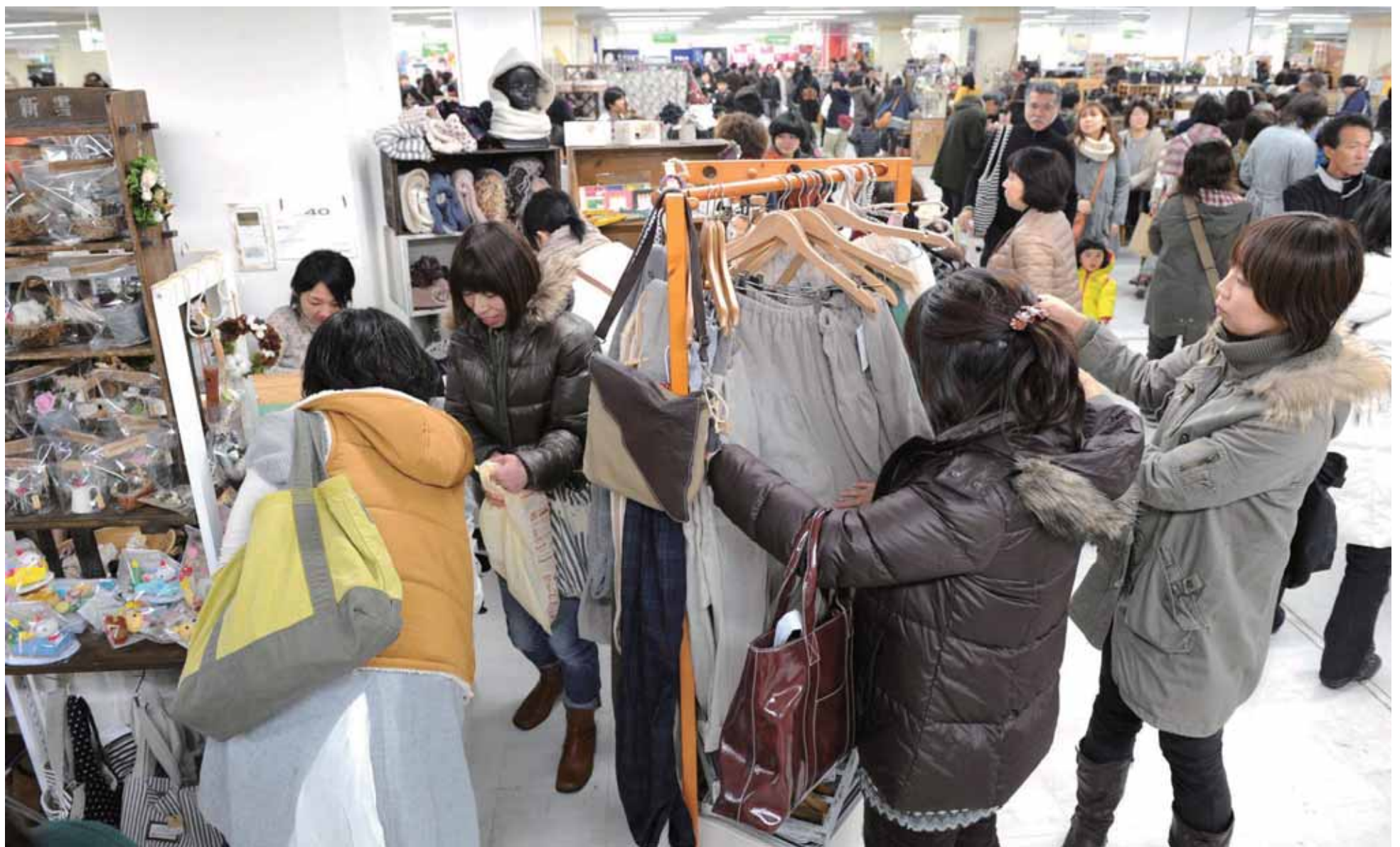
熱心に品定めをする人達。冬にかけて活躍する、毛糸の帽子や手作りの服などもたくさん並んだ