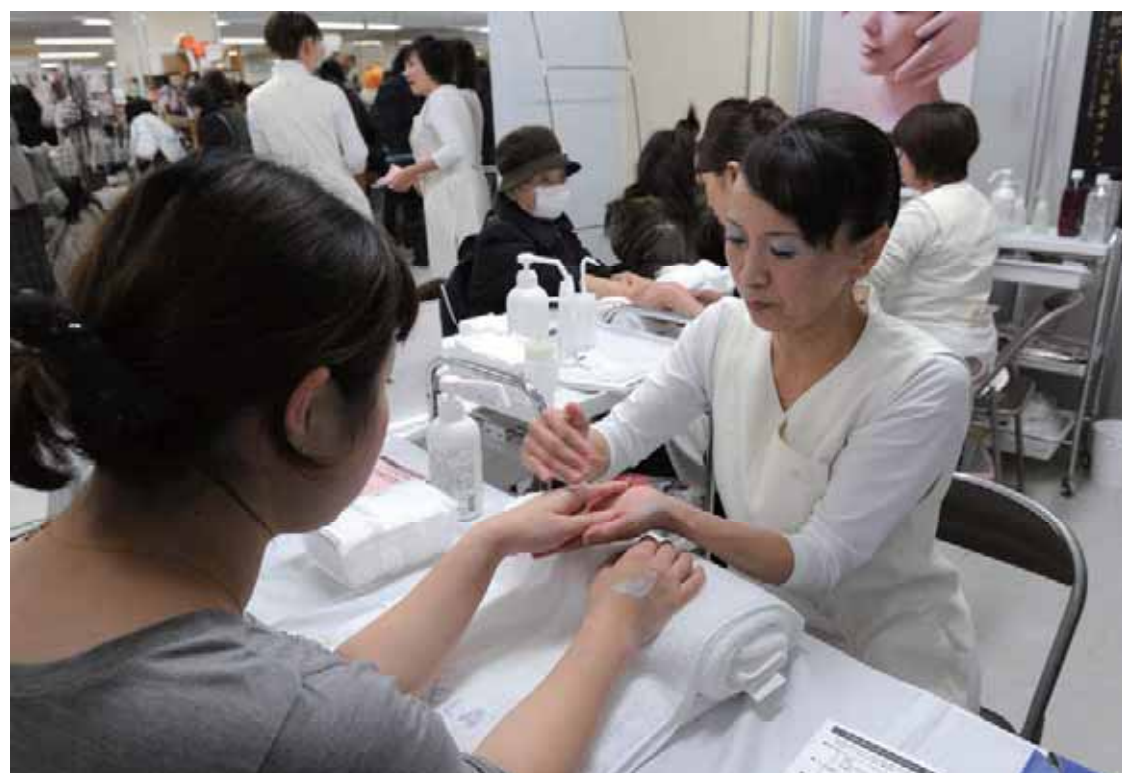
企業コーナーでは、化粧品メーカーが提供した、無料のハンドマッサージが人気に