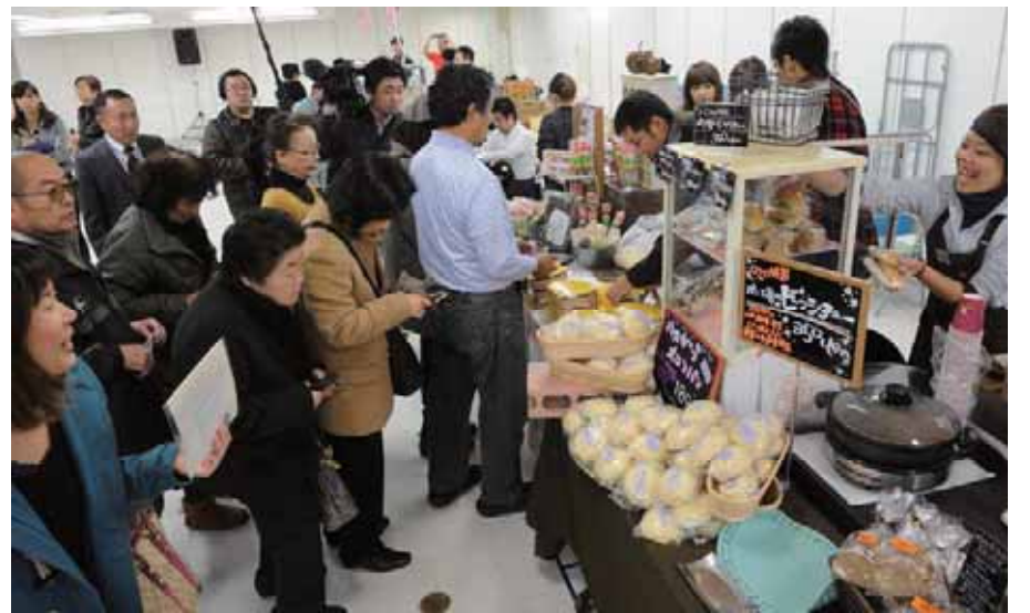
地元店によるフードコーナーも来場者でにぎわった