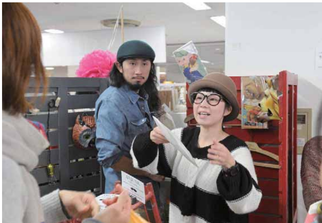
お客様との会話を楽しみながら販売する店主。次回作のアイデアもわいてくる