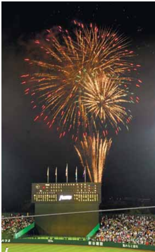
真夏のナイターを演出した花火

試合結果の詳細は北海道新聞、道新スポーツで。ご購入のお申し込みは0120・464・104(ヨムヨドーション)へ。