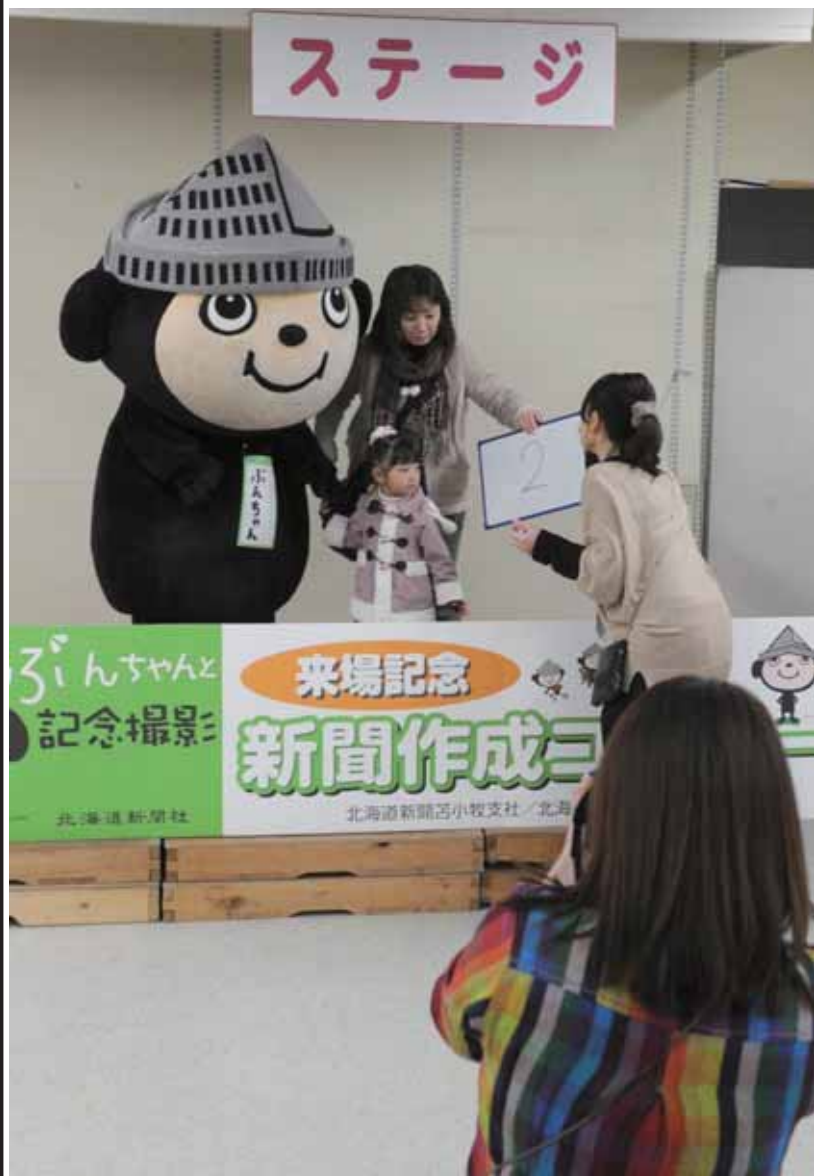
道新ぶんぶんクラブのキャラクター「ぶんちゃん」と記念撮影

【苫小牧】23日、「苫小牧よくばりマルシェ2013」(実行委員会、道新とまこむ編集室、北海道新聞苫小牧支社主催)が、苫小牧駅前プラザ egao 3階特設会場で開催された。