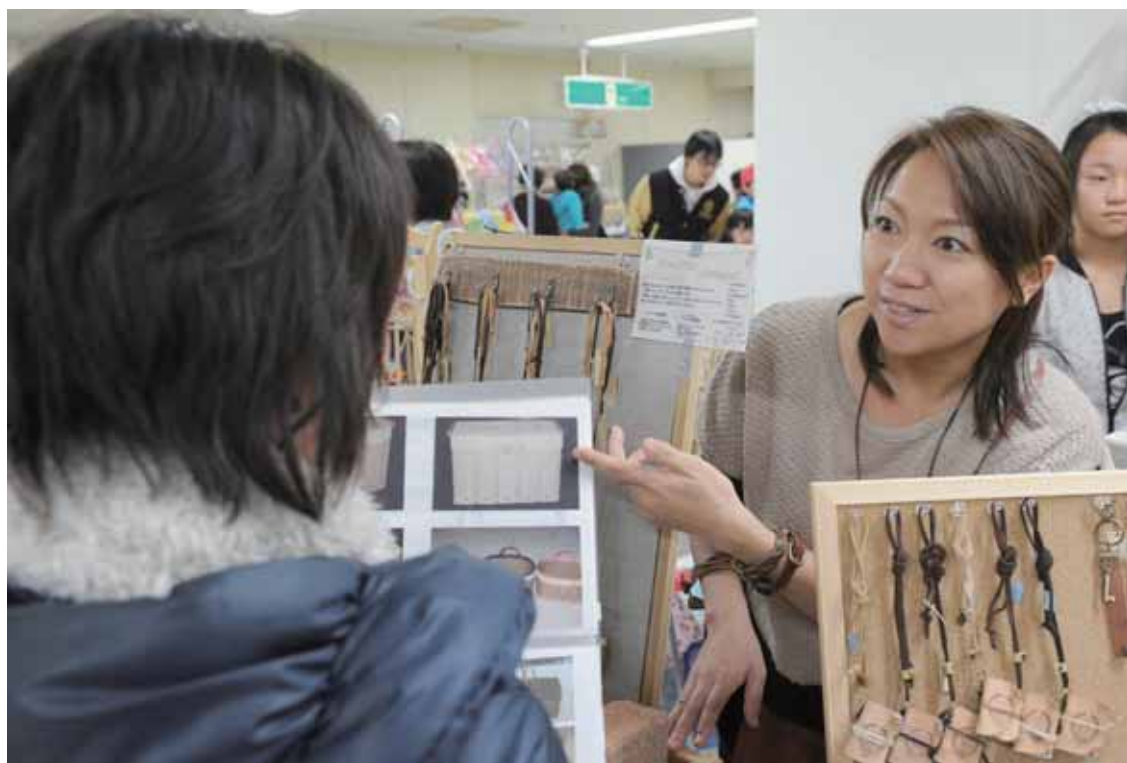
商品を挟んで対面販売。「お客様と顔を合わせて話が弾みます」と店主