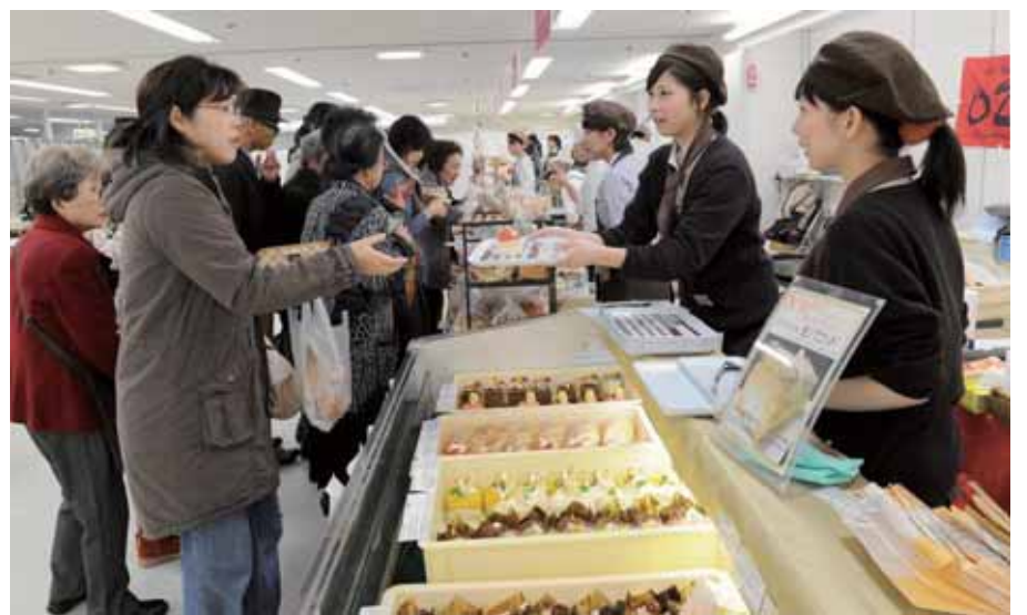
家で待つ家族のために、お土産スイーツも