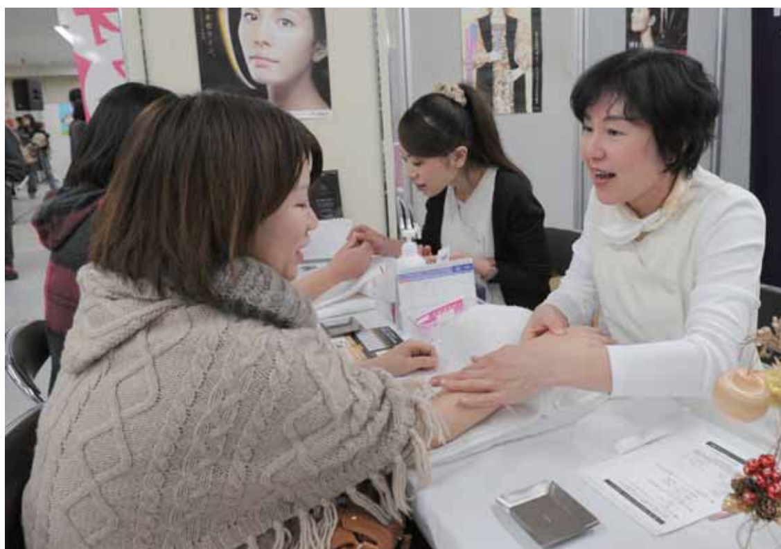
企業のPRコーナーでは、無料のハンドマッサージが人気を呼んだ