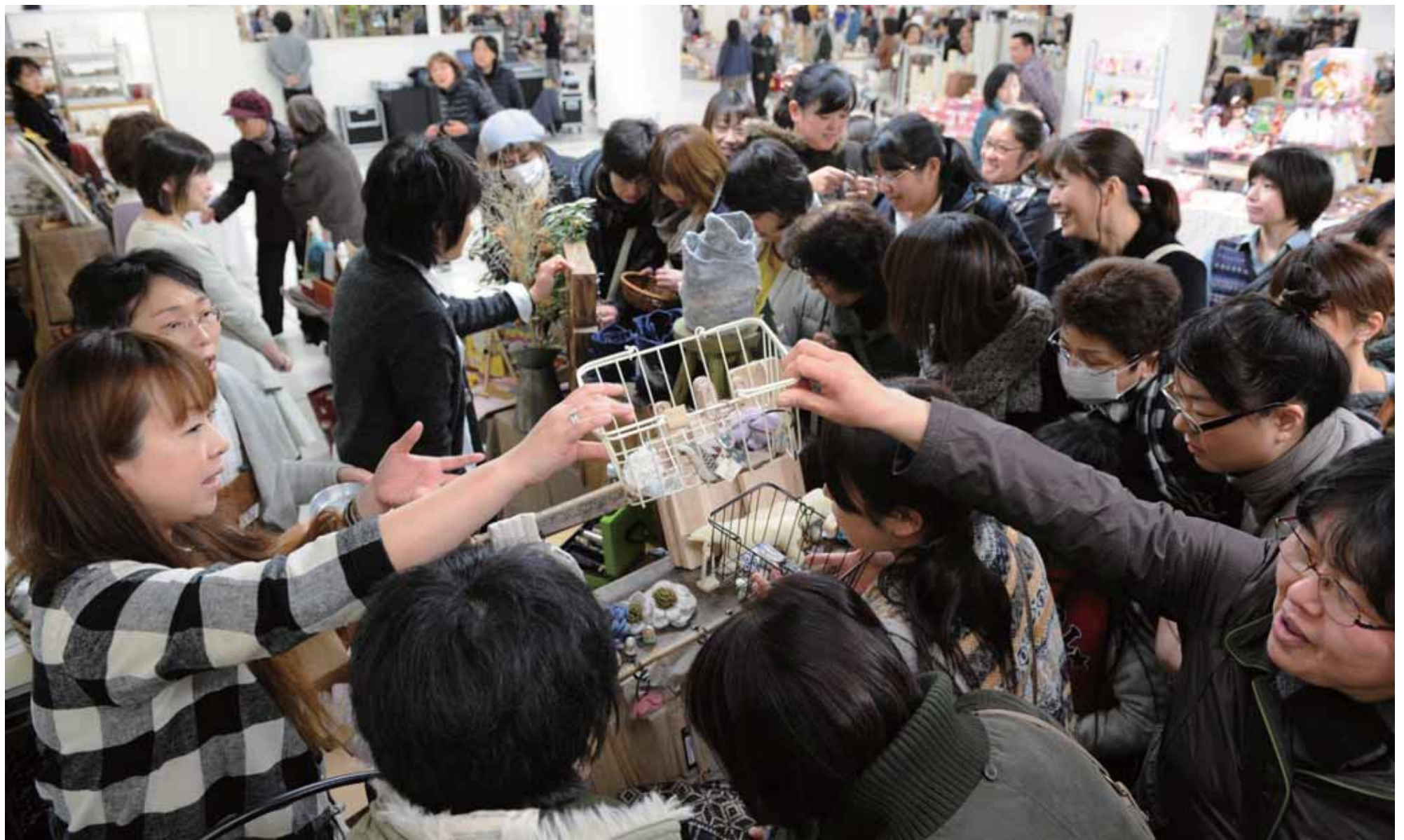
悩みながらも、好みの品を探し出すのも楽しいひととき