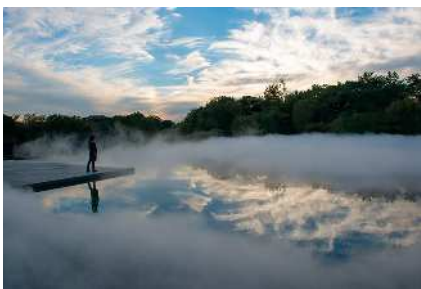
中谷美二子 《Fog Sculpture #47636 “風の記憶”》2013 豊田市美術館での展示風景

札幌芸術の森美術館 住所:札幌市南区芸術の森2丁目 開館時間:9時45分~17時30分(9月中は17時まで)無休