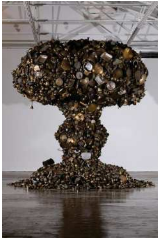
スपोर्ट・クラブ ▲ライオン・オブ・コントロール 2008 ▲ラリオ北京(中国)での展示風景

北海道立近代美術館 住所:札幌市中央区北1条西17丁目 開館時間:9時30分~17時 休館:毎週月曜(祝日日の場合は翌火曜)