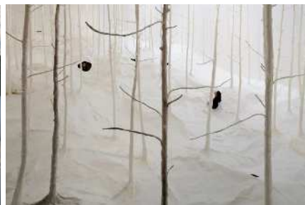
栗林隆 《ヴァルト・アウス・ヴァルト(林による林)》2010 個人蔵