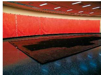
岡部昌生 床面:《北海道炭礦汽船真谷地炭礦電力所遺構》1998 壁面:《雄別炭礦病院屋上遺構》2009 「岡部昌生フロッターージュ・プロジェクト 雄別炭礦を掘る」展での展示風景(釧路市立美術館 2009)