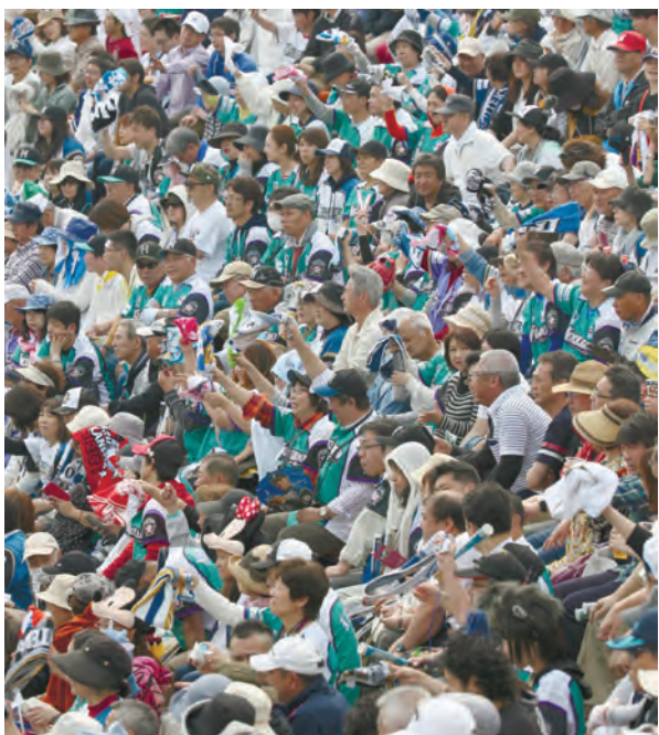
スタンドから声援を送る日ハムファン

道新&道スポプレゼンツ、プロ野球パ・リーグ公式戦、北海道日本ハムファイターズ―千葉ロッテマリーンズが26日、函館オーシャンスタジアム(函館市千代台公園野球場)で行われ、日本ハムはロッテに1―2で、十