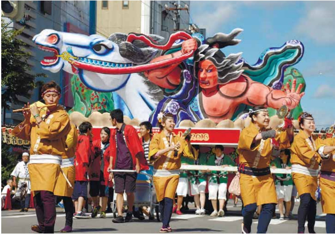
勇壮な山車を披露した青森のねぶた祭