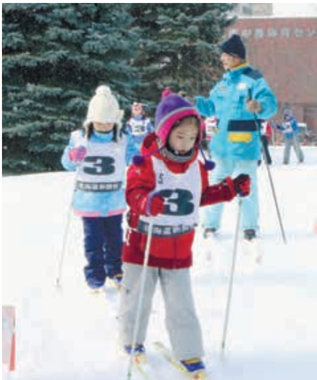
歩くスキーのコツを学んで楽しそうに滑る子どもたち