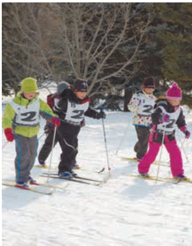
歩くスキーのコツを学んで楽しそうに滑る子どもたち