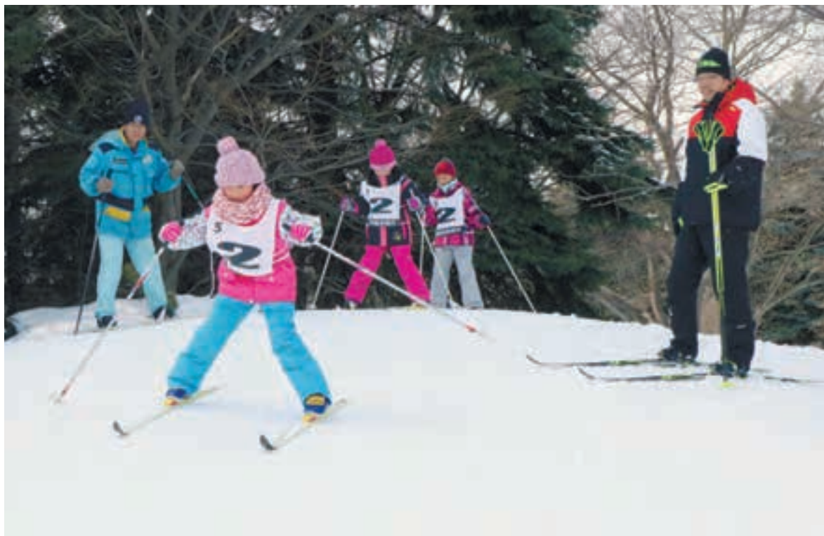
急な斜面も果敢に挑む子どもたち