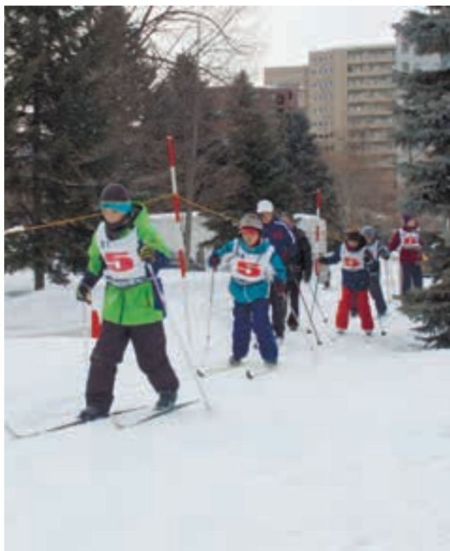
汗を流しながら歩くスキー指導を受ける子どもたち