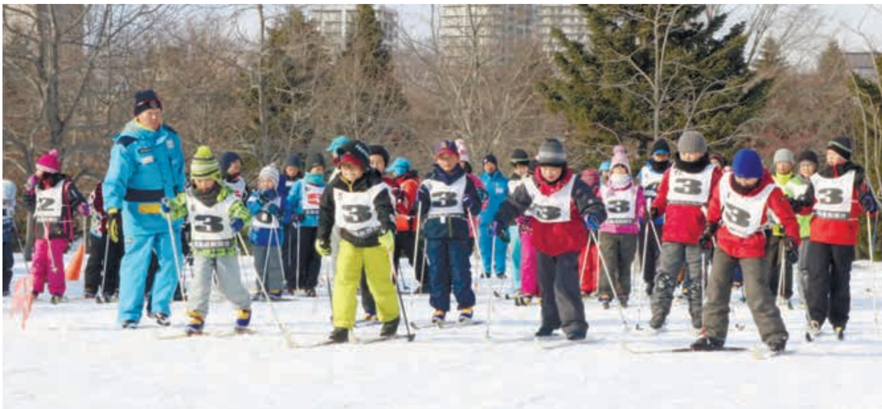
声援を受け力いっぱいスタートするミニレース