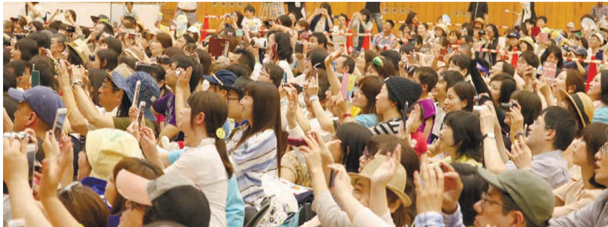
ふなっしーに盛んにシャッターを切る来場者たち