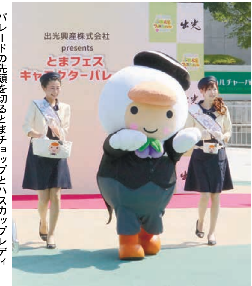
パレードの先頭を切るとまチョップとハスカップレディ

ゆるキャラたちは、オープニングで同パーク内をパレード。来場者のカメラに向かってポーズを取ると、「かわいい」と歓声が上がった。 午前11時からは、同パークに隣接する苦小牧市総合体育館で「ふなっしー」のショーが行われ、「とまチョップ」との「夢の共演」が実現。屋外ステージでも、人気者たちが次々と踊りやパフォーマンスを披露し、来場者を沸かせる。 会場には、フードコートも設けられ、地元東胆振をはじめ、道内各地の特産品が楽しめ、にぎわっている。