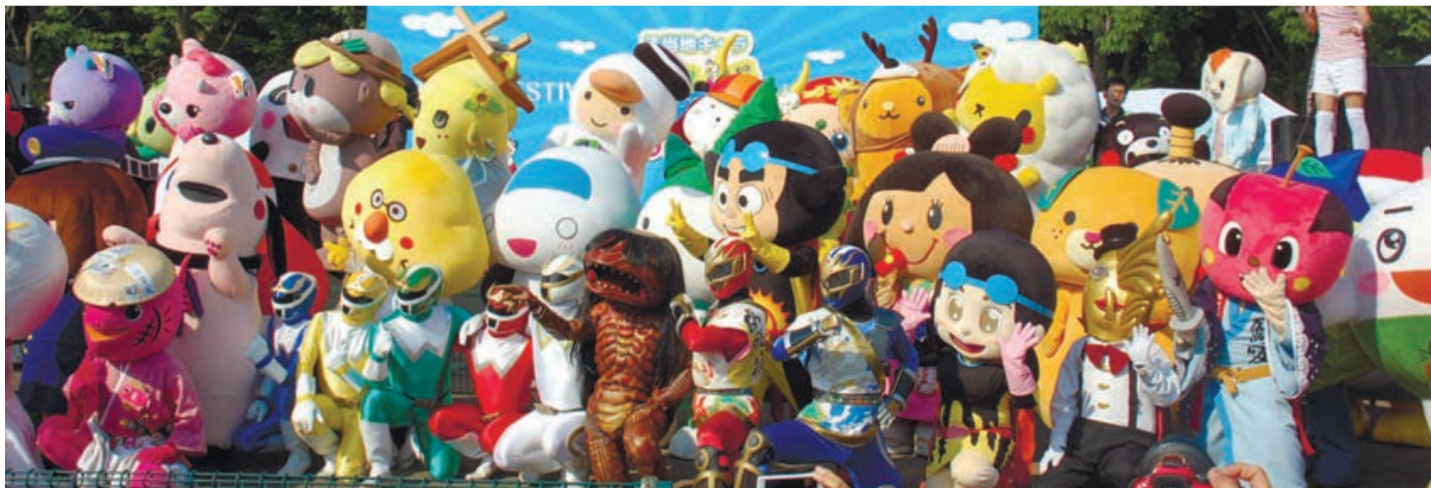
ご当地キャラが来場者に向かってポーズをとる集合写真撮影会＝8日