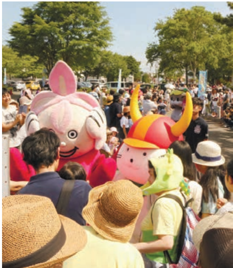
パレードで来場者とふれあうご当地キャラ

ゆるキャラたちは、オープニングで同パーク内をパレード。来場者のカメラに向かってポーズを取ると、「かわいい」と歓声が上がった。