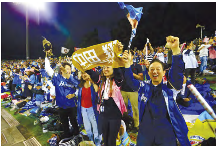
熱い声援を送るファイターズファン

道新・道スポプレゼン ツプロ野球パ・リーグ公 式戦の北海道日本ハムフ ァイターズ対埼玉西武ラ イオンズ戦が4日、旭川 スタルヒン球場で行われ